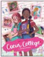
Coeur Collège, BEKA, DESSIN ET COULEURS, MAYA