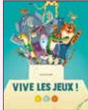
Vive les jeux! HERVÉ LE GOFF