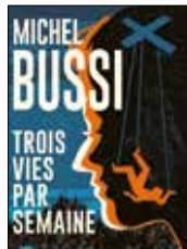
Trois vies par semaine, MICHEL BUSSI