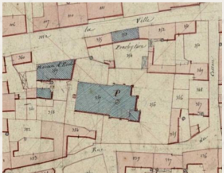
L'école se trouve proche de l'église et du presbytère rue « A mi la Ville ». Beine cadastre 1835

Recensement 1836 1055 habitants 284 ménages