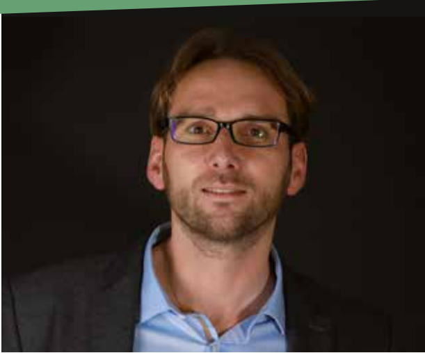
Romain BONHOMME Maire de Beine-Nauroy