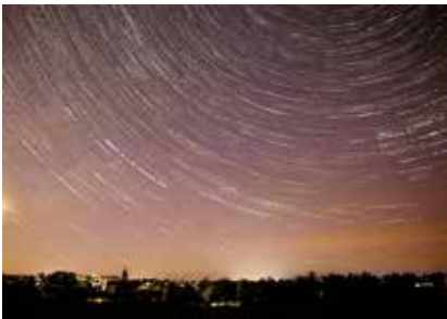
Ciel circumpolaire à Beine

Notre club s'est formé en autonomie sur l'astro photographie et quelques membres ont commencé à chasser les objets célestes. Rebecca a d'ailleurs réussi à immortaliser l'aurore boréale du 10 mai dans le ciel de Beine, un phénomène rarissime !