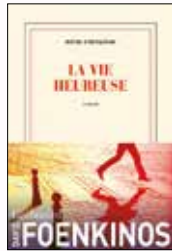
La vie heureuse, DAVID FOENKINOS